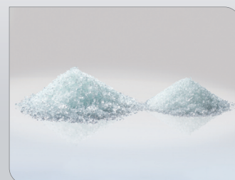
Filtrační sklo Crystal Clear