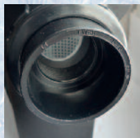
Rozebíratelné napojení Connection for PVC pipe D50 mm to glue