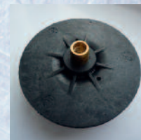
Turbínka s bronzovým zástríkem Impeller with brass inserts