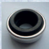
Těsnící segment z karbon-keramiky Mechanical seal in carbon-ceramic